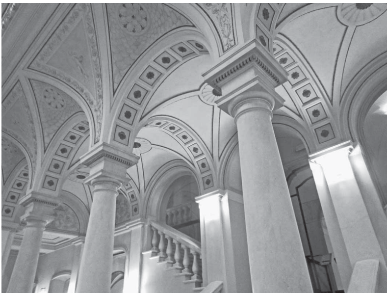
Atrio della Biblioteca Universitaria di Genova (c.a.)