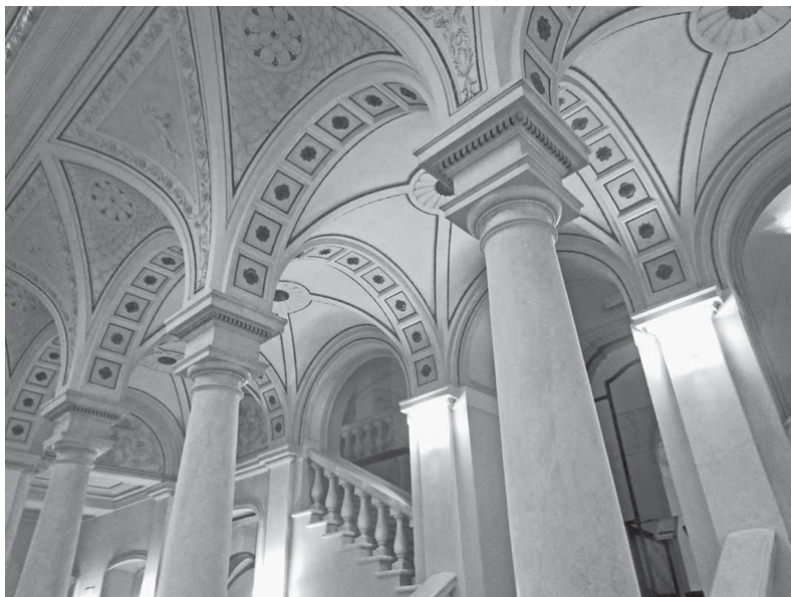
Atrio della Biblioteca Universitaria di Genova (c.a.)

(in M. Dagnino, Presente continuo , Stampa srl, Brunello, Varese 2007, p. 45)