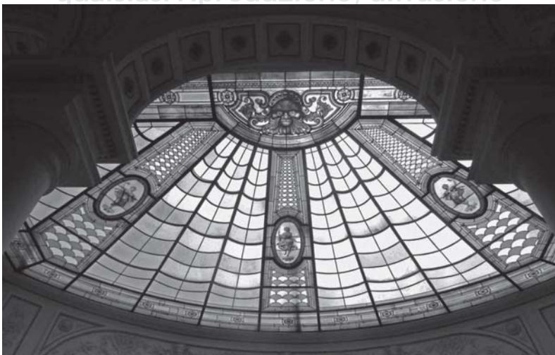
La cupola in vetro dell'atrio della Biblioteca (c.a.)

Devi guardare sempre in alto dentro la città, mi hai detto a voce alta fermamente indicando le gronde dei palazzi liberty, non so se poi ti riferivi più alla grazia che il cielo stringe nello scorcio fra gli attici o alle decorazioni appena restaurate. Non potevi sapere che l'avevo scritto in una delle mie lettere, anni fa, a un amico indomabile, non potevi trovare in mezzo alle mie macerie la fenditura più fine.