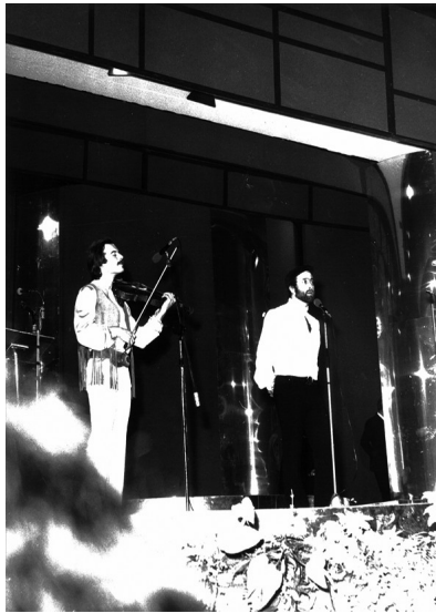
Lucio Dalla sul palco di Sanremo '71