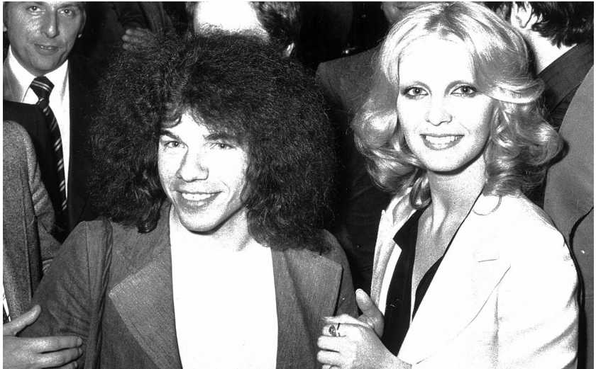
Riccardo Cocciantè e Patty Pravo, giovanissimi