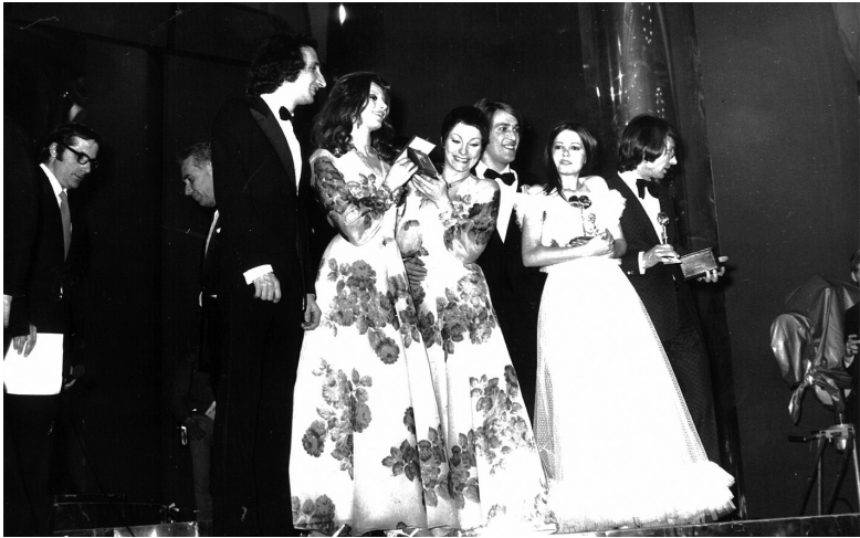
I Ricchi e Poveri, Nada e Nicola Di Bari sul palco del Festival di Sanremo 1971