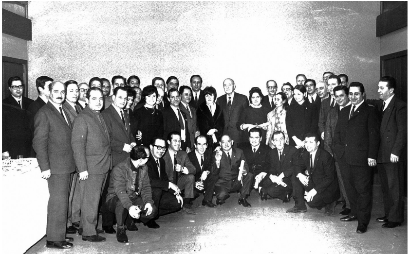
Foto di gruppo, anni Ottanta