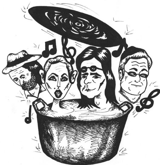
La Grande Pentola, disegno di Pietro Valenziano