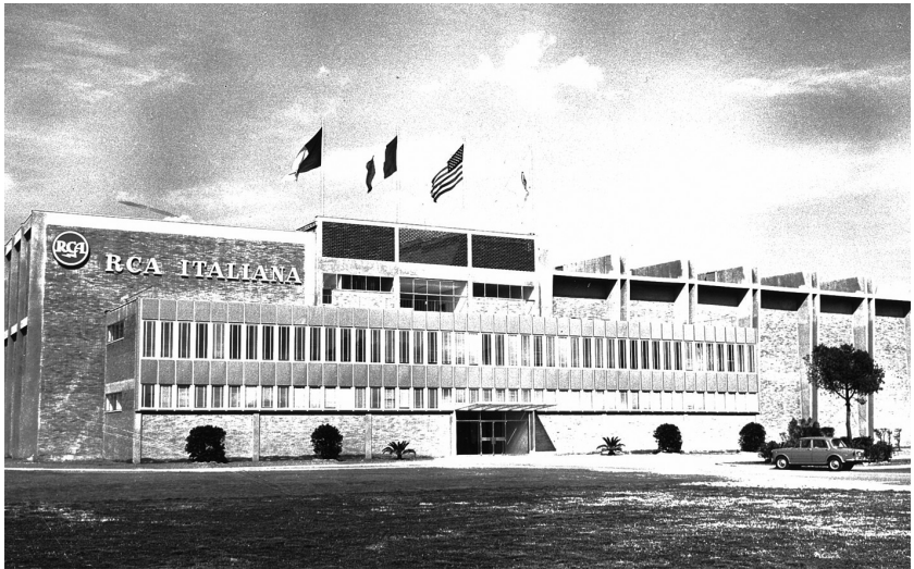
La storica Palazzina Studi, via Tiburtina Km 12