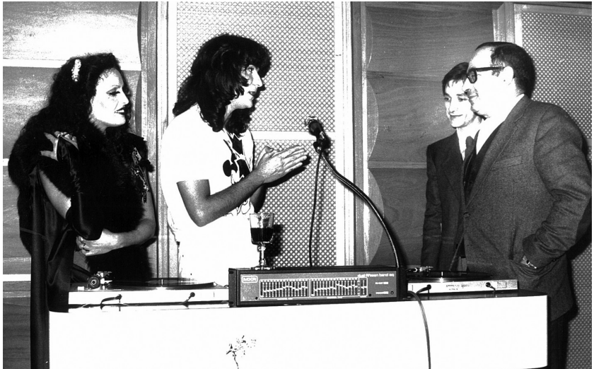
Un giovanissimo Renato Zero con Ennio Melis