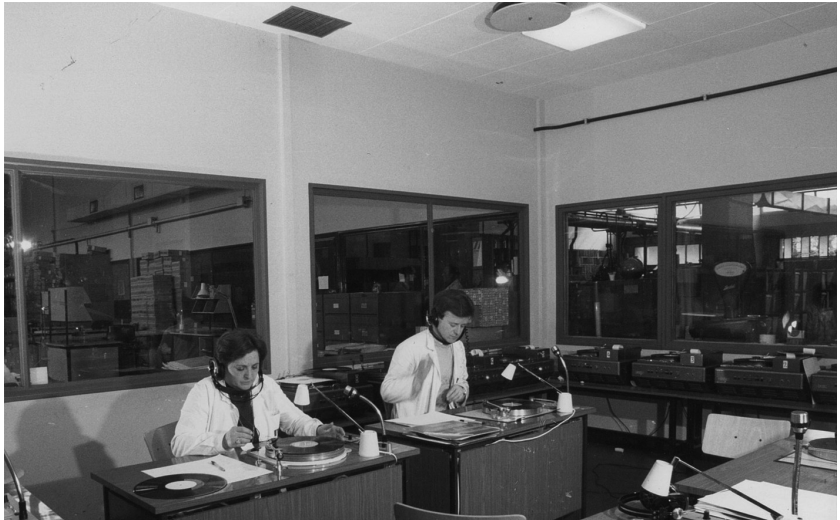
Reparto controllo acustico dischi, anni Settanta