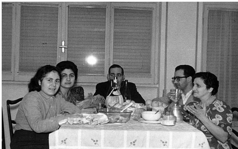
La famiglia Melis a Roma, in viale Pinturicchio