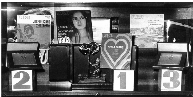
Il trionfo della RCA a Sanremo 1971: al primo posto Nada in coppia con Nicola Di Bari con Il cuore è uno zingaro , al secondo posto José Feliciano in coppia con i Ricchi e Poveri con Che sarà , al terzo 4/3/43 di Lucio Dalla in coppia con l'Équipe 84