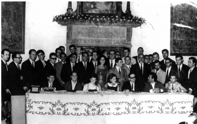
Convention RCA a Montecatini, negli anni Sessanta