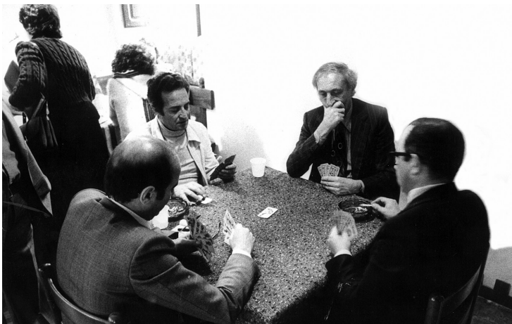
Giochi di carte al Cenacolo