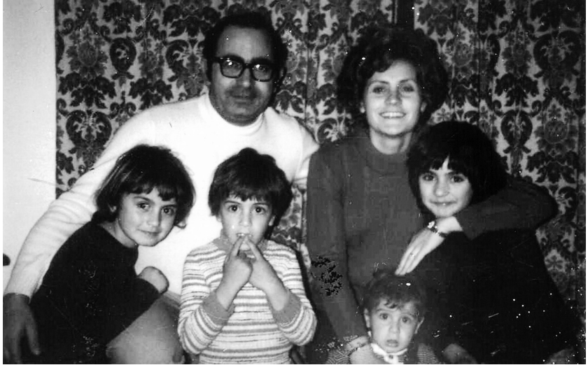
La famiglia Melis (1973)