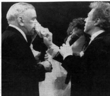
Frank Sinatra, bel il concerto all'arena di Pompei

Poco prima delle ventuno e trenta i cancelli dell'arena di