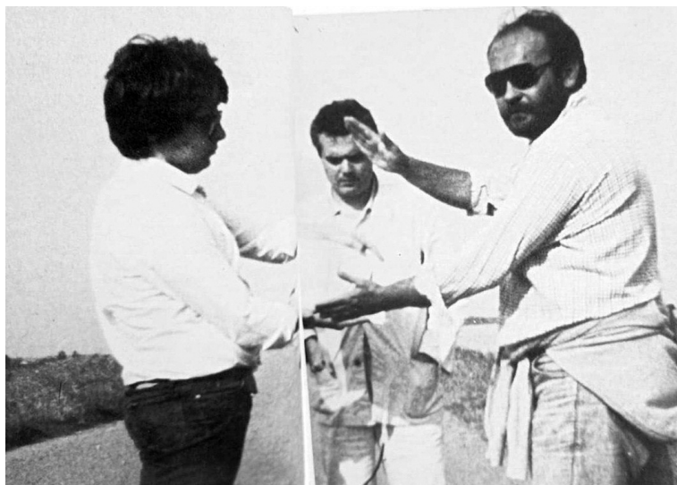
Fig. 1. Sul set di Effetti personali di Giuseppe Bertolucci, 1983.

Anche quando affrontano argomenti convenzionalmente iscritti nella sfera politica, i loro film non trascurano le «implicazioni più intime e private dei protagonisti»: 13 nessun moralismo, nessun desiderio di spiegare la realtà, semmai di immaginarla, di raccontarne analiticamente i «segreti segreti», tra rappresentazioni e reticenze. In un'industria cinematografica che si appella al bisogno del pubblico di evadere dalla realtà, un punto di contatto tra Bertolucci e Giordana è quello di essere paladini di un cinema d'autore, aperto alla sperimentazione di stili, forme, generi (il noir , la detection , il melodramma, per non dire della frequentazione del teatro e della lirica), senza il pregiudizio di chi vede nel mezzo televisivo solo una piaga virulenta che avrebbe contagiato e soppresso il grande schermo. Una rara sensibilità, profusa anche nell'attenzione verso i personaggi femminili e le attrici predilette che li incarnano, come Alida Valli 14 e Sonia Bergamasco. Giuseppe la fa risalire non solo al rilievo della donna nella società contemporanea, ma soprattutto alla «sorgente narrati-