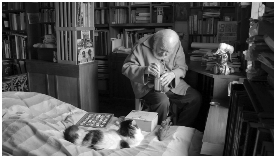
Fig. 1. Fermo immagine dal film The House He Built , Caterina Borelli, 2020

Se nel passato ho sempre guardato a luoghi pubblici (città, villaggi o edifici) nel 2019 con il documentario The House He Built 3 ho messo al centro il luogo che viene considerato il più privato per eccellenza: una casa di famiglia. Preparando questo lavoro, nel 2017 ho scritto un saggio per la rivista belga Mnemosyne . 4 In quel contributo spiegavo le ragioni all'origine del documentario, un film in cui la casa di mio padre è protagonista. L'articolo traccia un percorso dall'idea iniziale di biografia in tre dimensioni, al suo sviluppo, in un'osservazione della relazione sensoriale che si crea tra persona, spazio e oggetti, come tra memoria, spazio e tempo.