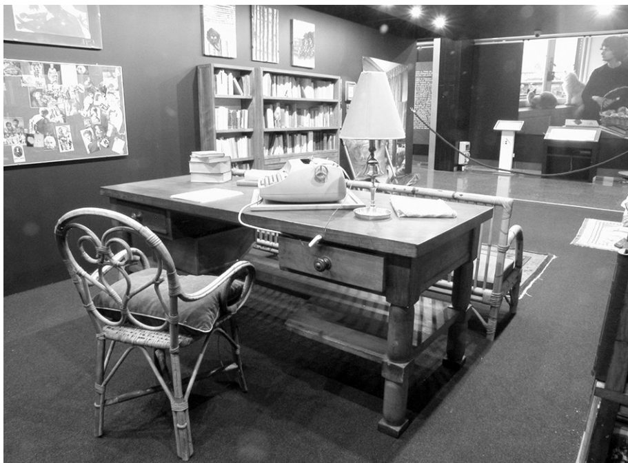
Fig. 1. La stanza di Elsa, Spazi900, Biblioteca nazionale centrale di Roma.

Nello spazio della scrittura Morante è in compagnia di figure per lei centrali, ma il bene più prezioso rimane la carta. Risme di carta Fabriano Cartiere Miliani (chinese paper bianco) sono presenti tra gli scaffali, sulla scrivania, e soprattutto fogli bianchi sono custoditi all'interno di un "forziere" in ferro chiuso a chiave, posto accanto alle librerie, quasi nascosto alla vista.