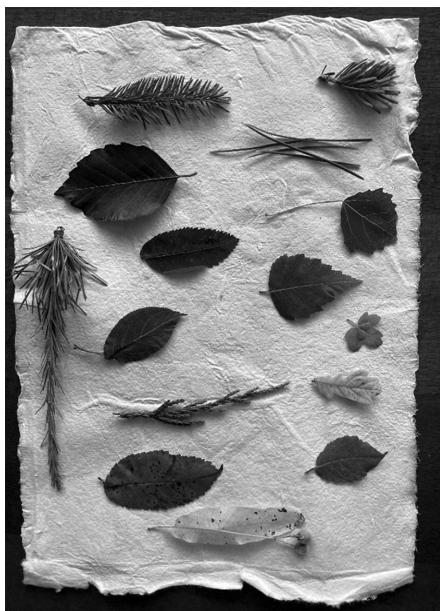
Fig. 1. L'erbario di foglie raccolte dall'arboreto di Mario (estate 2025).

Finisce così questa passeggiata tra gli spazi vissuti del quotidiano di uno scrittore sensibile alle cose e alle piante, che arreda la sua casa con un mondo di storie e per cui ogni oggetto nasconde un senso e un racconto. Allontanarsi da quella casa rosa, oggi che lo scrittore non vive più lì, fa avvertire il peso dell'assenza. Povero è l'Altopiano senza la sua voce. La casa giace silenziosa, priva di quello spirito protettore della vita delle montagne. Basta voltarsi indietro però per scorgere le fronde degli alberi da lui piantati e magari sentirli frusciare le loro storie.